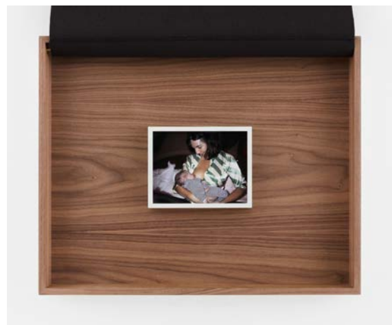
Sophie Calle, Sans enfants, sein , 2018

© Sophie Calle / ADAGP, Paris, 2019, Courtesy of Perrotin and Gallery Koyanagi / Photo: Claire Dorn