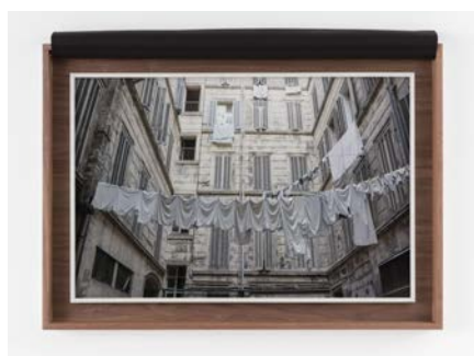
Sophie Calle, Suaires シュラウド (屍衣)